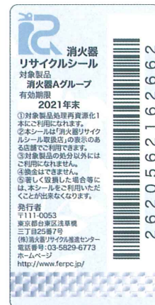
新製品用消火器 リサイクルシール 有効期限 10年